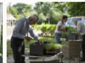
Het onderhoud aan het erf.