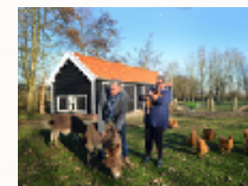
Kleinvee project met ezeltjes en kippen.

Het kleinvee project biedt de mogelijkheid voor deelnemers om met aabare kippen en ezeltjes te werken. Het verzorgen van de dieren, het voederen, schoonhouden van de stal, het rapen van de eieren en het onderhoud van de weide, biedt de deelnemers de mogelijkheid om zinvolle activiteiten uit te voeren. De bijdragen worden gebruikt voor de aanschaf van kleinvee, voer en verzorging van de dieren.