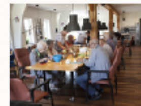
Gezamenlijke activiteit in de groepsruimte

Het fietsproject biedt de mogelijkheid voor deelnemers om actief te bewegen. De omgeving van de boerderij is uitermate geschikt om op een z.g. Quattrofiets met meer deelnemers te bewegen in de buitenlucht. De bijdrage wordt gebruikt voor de aanschaf en onderhoud van de Quattrofiets.