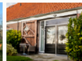
Toegang tot de groepsruimte van de zorgboerderij.