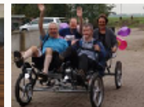
De Quattrocycle in gebruik.